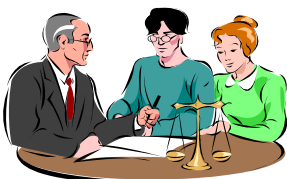
Varga Tünde polgármester